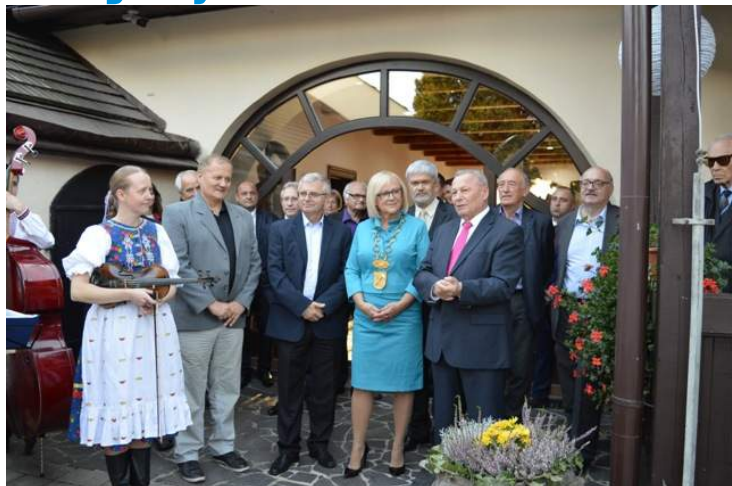
Vítanie hostí v Parku národovcov.