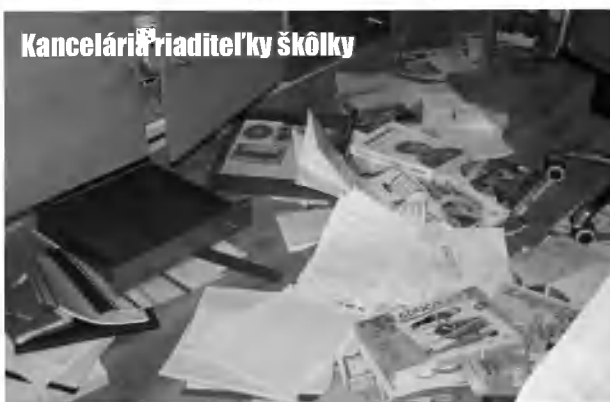
Kancelária riaditeľky škôlky