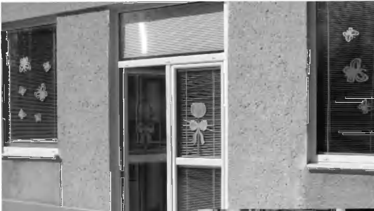
Cez tieto dvere zo záhrady vnikli do budovy

V pondelok ráno 23.marca 2015 čakalo zamestnancov škôlky na Sládkovičovej ulici nemilé prekvapenie. Počas víkendú navštívili budovu škôlky návštevníci, ktorí si dvere neotvárali kľúčom. Dovnútra sa dostali cez balkónové dvere zo záhrady, ktoré rozbili a následne si dvere otvorili kľučkou z vnútornej strany dverí. Do tried a ostatných miestností škôlky sa opäť dostali cez rozbité sklenené výplne dverí a dvere do kancelárie riaditeľky jednoducho vypáčili. V triedach zobrali notebooky a hotovosť v sume 200 €, našťastie tu väčšie škody na zariadení nespôsobili. Inak to vyzeralo v kancelárii riaditeľky. Odtiaľ vzali monitor počítača a zrejme pri hľadaní hotovosti narobili v miestnosti hotovú spúšť. Keďže sa iná hotovosť v škôlke už nenachádzala, páchatelia vzali čo našli a tak ako prišli, aj odišli. Podľa vyjadrenia riaditeľky