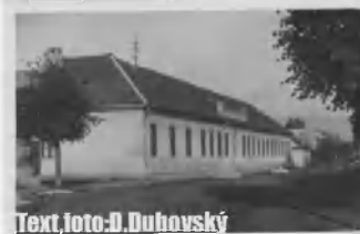
Text, foto-D. Dubovský