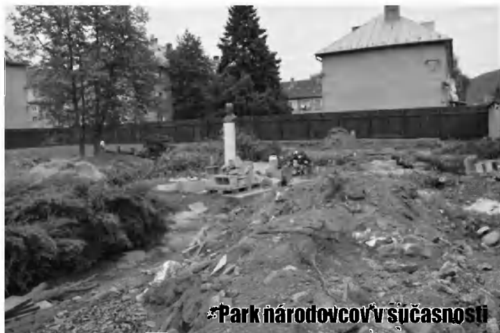
Park národovcov v súčasnosti