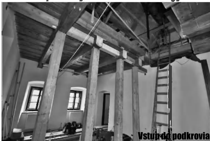
Vstup do podkrovia

V júli 2015 bola prevádzka turistického informačného centra dočasne presťahovaná z priestorov historickej budovy Prvého slovenského gymnázia na Muránskej ulici do budovy Mestského úradu v Revúcej. Dôvodom je rekonštrukcia budovy a areálu.